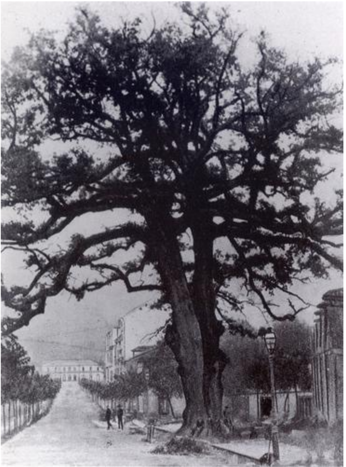
El Carbayón de Oviedo