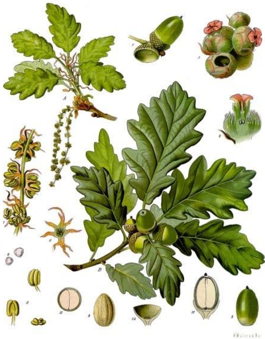
Hojas y frutos del carvayo