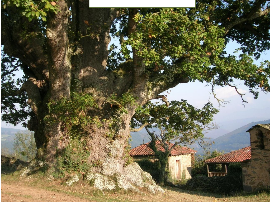
El carbayo de San Valentín tiene un perímetro de 7 metros