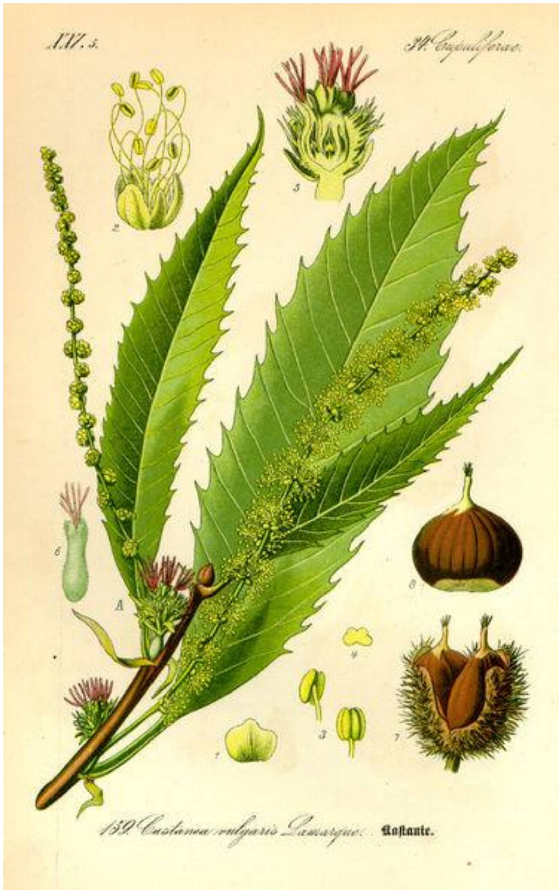
Hojas y frutos del castaño