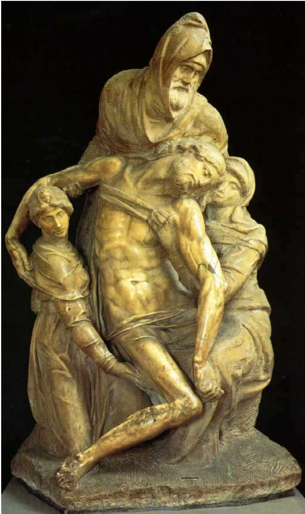
Piedad del Duomo de Florencia 1549-1555