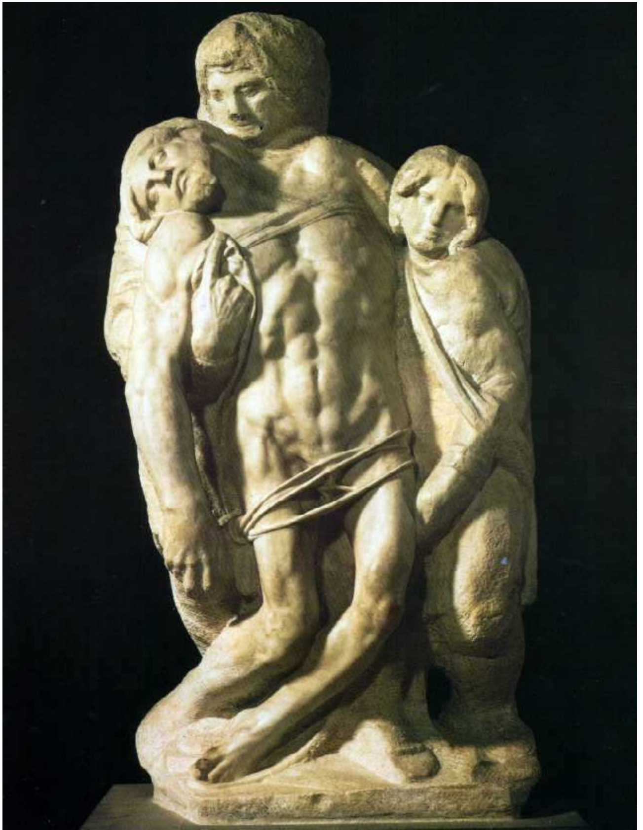
Piedad de Palestrina 1555-1559