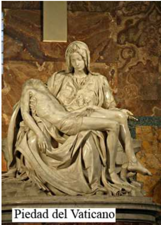
Piedad del Vaticano

La Pietà Rondanini parece constituir el punto final de la obra escultórica de Miguel Ángel y nos seduce, dentro de su inacabamiento, por su religiosidad austera que no se ajusta a las recomendaciones del Concilio de Trento.