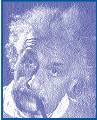
ALBERT EINSTEIN (1879 -1955)