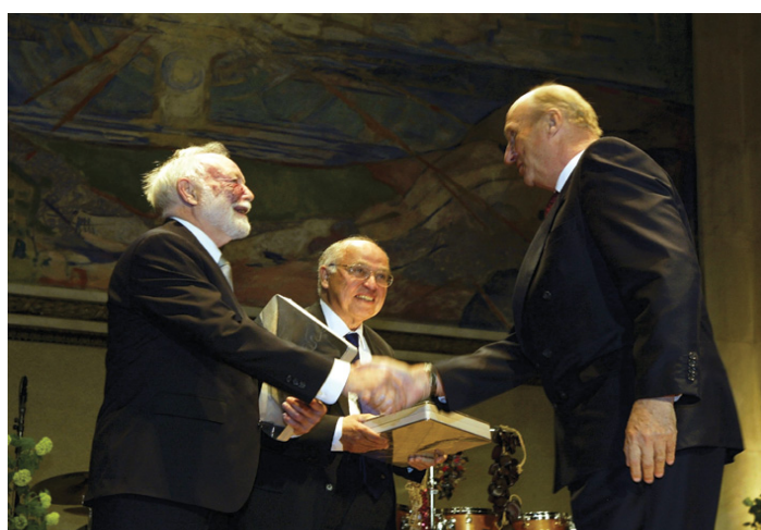
SU MAJESTAD EL REY HARALD DE NORUEGA HACE ENTREGA DEL II PREMIO ABEL, EL 25 DE MAYO DE 2004, A ISADORE SINGER Y SIR MICHAEL F. ATIYAH EN LA UNIVERSIDAD DE OSLO

El galardonado con la primera edición del Premio Abel fue el matemático francés Serre, debido a "su papel central en la elaboración de la forma moderna de diversas partes de las Matemáticas...", según el jurado del premio otorgado en Oslo en 2003. Serre, aunque dedicado a la matemática abstracta, ha contribuido notablemente al desarrollo de sistemas de encriptación de mensajes o de corrección de errores en la transmisión de datos.