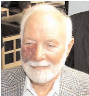
ISADORE M. SINGER (1924-)

El premio de esta edición ha recaído en dos matemáticos mundialmente famosos de nuestra época, Atiyah y Singer, por su gran contribución a esta disciplina con su Teorema del Índice. Este teorema, del que trataremos detalladamente en la siguiente lámina, unifica campos muy generales de la matemática, como son el Análisis, la Geometría y la Topología, para dar respuesta a multitud de fenómenos físicos, uno de los principales es la Teoría de Supercuerdas y la Física Cuántica. El extraño mundo de los matemáticos se hace visible una vez más en el espacio que nos rodea.