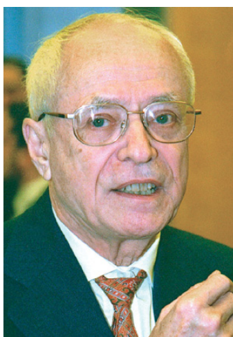
JEAN-PIERRE SERRE (1926-)