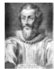
FRANCOIS "VIÈTE" (1540 - 1603)

J OHAN NAPIER no sólo creó los huesos en su interés por mejorar los procedimientos de cálculo. Más allá de los logaritmos creó una máquina de calcular que ampliaba las posibilidades de sus huesos y a la que llamó " Multiplicatio-nis Promptuarium ". Con este instrumento, Napier consiguió solucionar el principal inconveniente del uso de los huesos : al calcular con ellos, había que anotar los resultados intermedios; con el promptuario consiguió automatizar todo el cálculo algebraico. Además introdujo cambios en la notación matemática, un tema