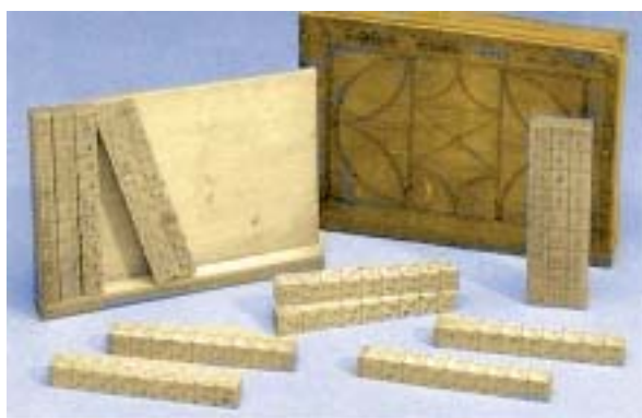
JUEGO DE HUESOS DE NAPIER DEL SIGLO XVIII EN MADERA

Los huesos de Napier se construían como un juego de diez varillas oblongas en cada una de cuyas caras laterales se inscribían las tiras de los múltiplos de los primeros nueve números. Pero se emparejaban por complementos a 9, es decir, las parejas de cada varilla sumaban 9. Por ejemplo en la quinta varilla estaban inscritos los múltiplos del 1, 2, 8 y 7. Si observas 1+7=2+8 (son complementarios). Además se inscribían invertidos: el 2 y el 1 boca arriba y el 7 y el 8 boca abajo. Estos refinamientos mejoraban su uso.