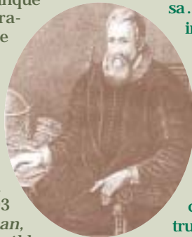
JOHN NAPIER (1550 - 1619)