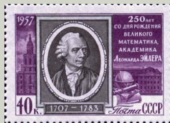
Leonard Euler (1707 -1783)