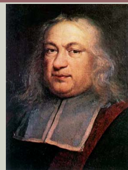
Pierre Fermat (1601 -1665)

encontró a la pareja amistosa 9.363.584 y 9.437.056. El gran Euler tuvo un gaza-po en sus cálculos cuando construyó una tabla con 64 parejas de amigos, de los que más tarde se demostraría que una pareja era de falsos amigos. Resulta