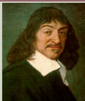
René Descartes (1596 -1650)

ordenadores, ya que muchos de ellos ocupan cientos de páginas.