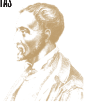
GEROLAMO CARDANO (1501-1576)

Nuestra historia aconteció en la Italia renacentista del siglo XVI. Desde hacía casi tres siglos, las matemáticas se enseñan en las ESCUELAS DE ÁBACO, donde sobre todo se impartía ALGEBRA, y en especial las técnicas para resolver ecuaciones. Aunque las