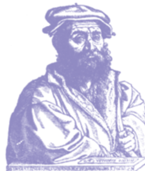
NICCOLO FONTANA TARTAGLIA (1499-1557)