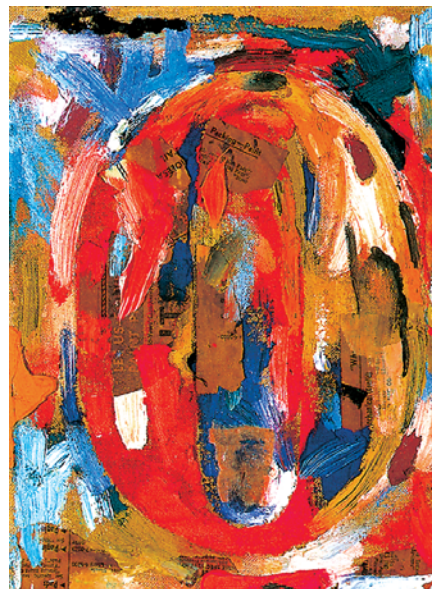
'De 0 a 9' (fragmento) Jasper Johns hacia 1930

marca en algunas columnas "vacías". Ptolomeo, en su Almagesto , también utilizó este recurso. Pero no se trata de un uso posicional y no trascendió su uso.