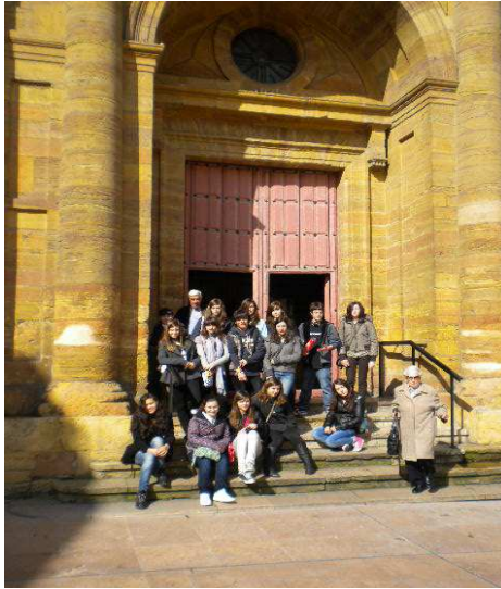
La iglesia de San Isidoro el Real