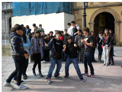
Plaza de la catedral