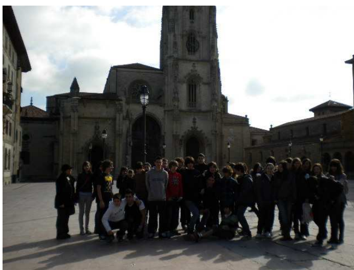
Catedral de San Salvador