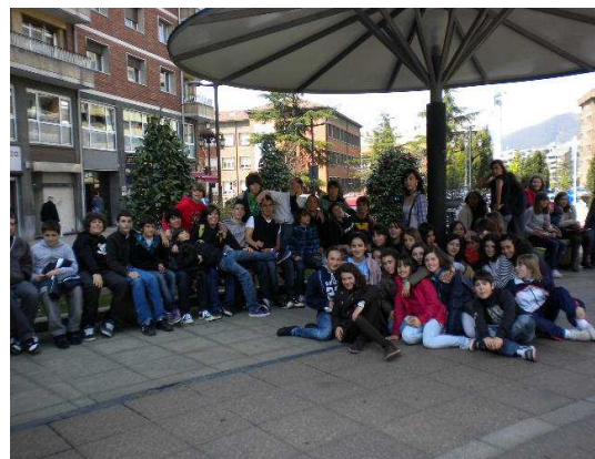
Plaza de la gesta