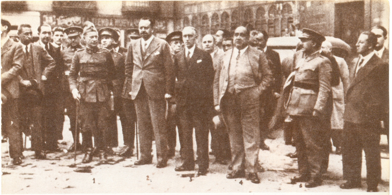
Los ministros de Guerra (2, Hidalgo), Justicia (3, Aizpún) y Obras Públicas (4, Cid) visitan Oviedo tras los sucesos de octubre. Les acompañan los generales López Ochoa (1) y Franco (5)

La derrota fue cruenta y sangrienta especialmente para la clase obrera. Octubre costó muchas vidas: a nivel de todo el estado español se contabilizan 3.000 bajas, sobre todo del bando revolucionario, 7.000 personas heridas y 30.000 detenidas o encarceladas , acusadas de dirigir o participar en el levantamiento; entre ellos están algunos dirigentes políticos que habían sido ministros en el primer bienio de la República (1931-33), cuya imagen pública se trataba de ensombrecer; así por ejemplo, Largo Caballero fue detenido y permaneció en presidio hasta noviembre de 1935. Pero la persecución políticamente más dura se dirigió contra Azaña , que estaba en Barcelona la noche del día 5 de octubre, y de quien se llegó a decir -sin ningún fundamento, como después pudo comprobarse- que había dado su beneplácito al manifiesto de Companys que proclamaba el estado catalán dentro de la República Federal Española.