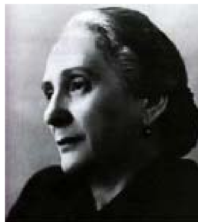
DOLORES IBARRURI “PASIONARIA”