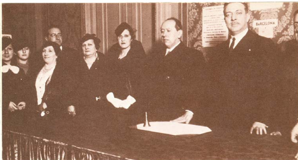
José M a Gil Robles (en el centro de la foto) en los locales barceloneses de Acción Popular, uno de los partidos políticos integrados en la CEDA, el 3 de Febrero de 1934.