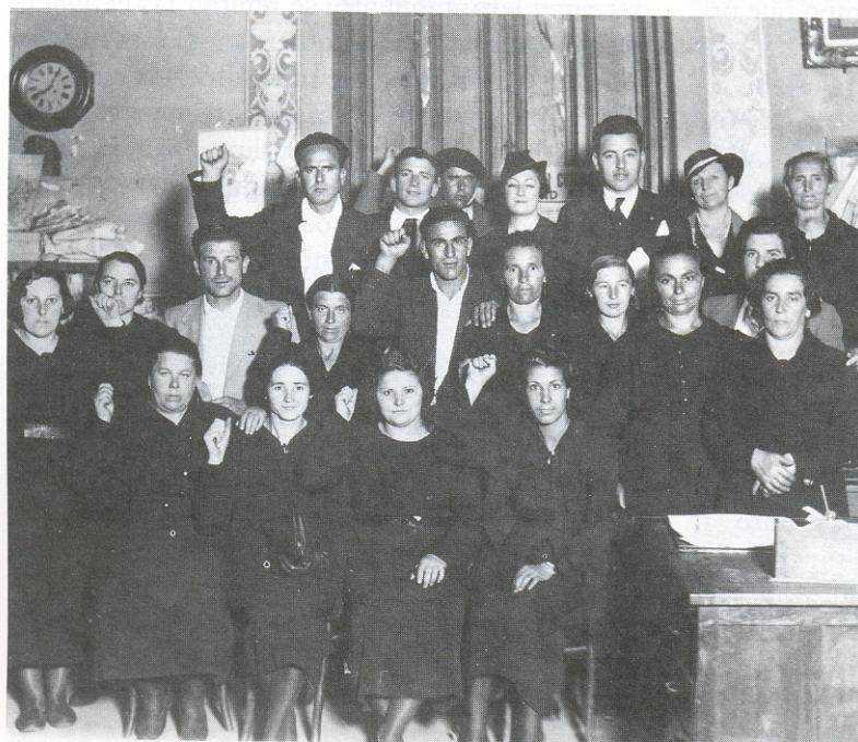
Mujeres v compañeras de los mineros detenidos. Asturias. 1934